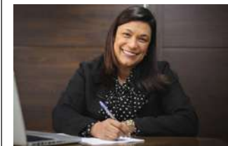
MARIA ROSAS é deputada federal pelo Republicanos, São Paulo.