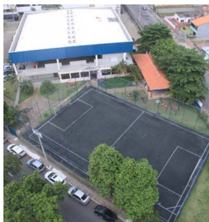
Unidade EDE Parque Industrial

A ADC EMBRAER faz parte da evolução esportiva da cidade. Sempre com equipes fortes e vencedoras em todos os esportes, fez com que o nível das competições municipais subisse de patamar. Além disso, em busca de aumentar o nível das suas equipes esportivas e representar a cidade de São José em voos cada vez mais altos, se tornou o único clube de campo joseense a se associar na FENACLUBES (Confederação Nacional dos Clubes), uma entidade sem fins lucrativos que tem a missão de promover e articular ações de defesa da categoria clubística e representar, perante os poderes públicos, os direitos e interesses gerais dos clubes.