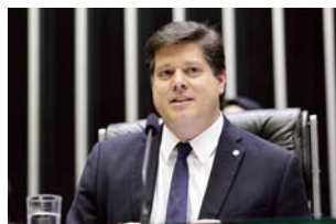
BALEIA ROSSI é deputado federal por São Paulo e presidente nacional do MDB.