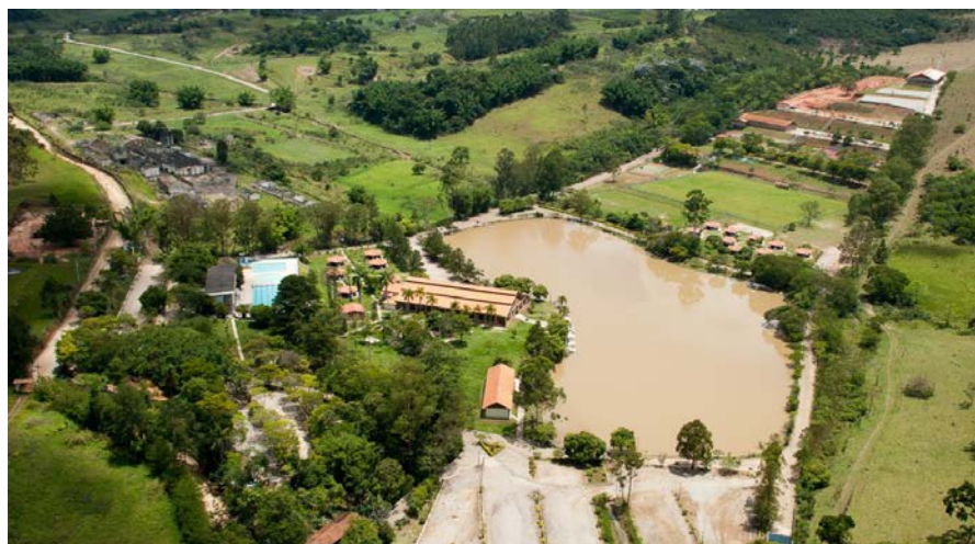
Clube de Campo