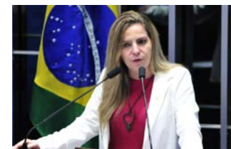
LUIZIANNE LINS é deputada federal pelo Partido dos Trabalhadores, Ceará.