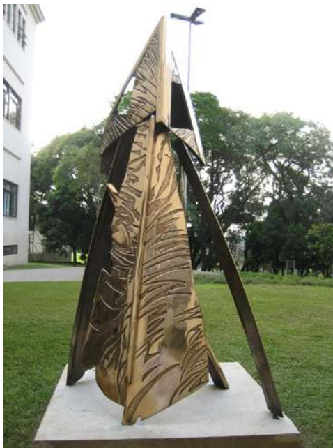
O Descobrimento (Navegar é Preciso...)