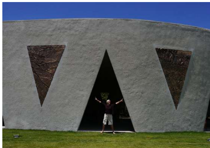
Fundida em bronze