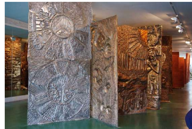
Etnias: do Primeiro e Sempre Brasil