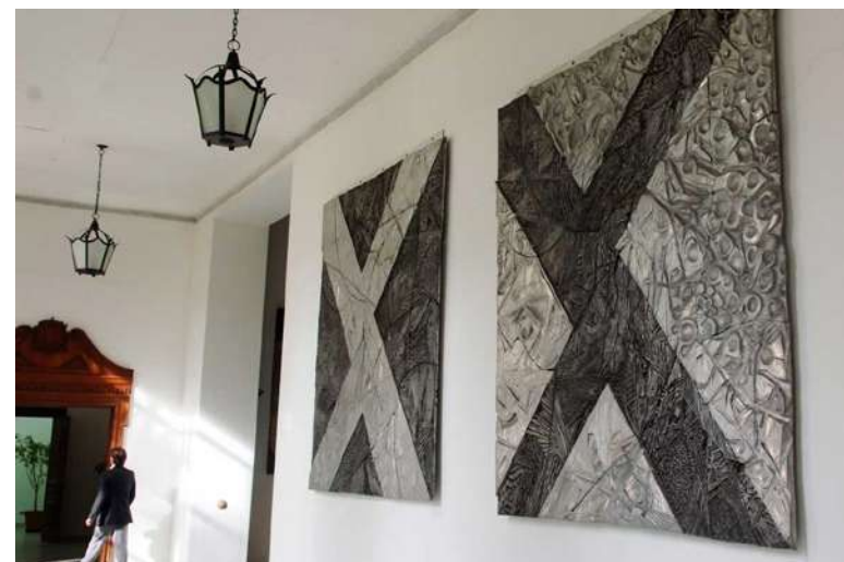
Imigração e Substituição