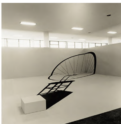
In Absentia M. D.