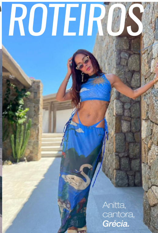
Anitta, cantora, Grécia.