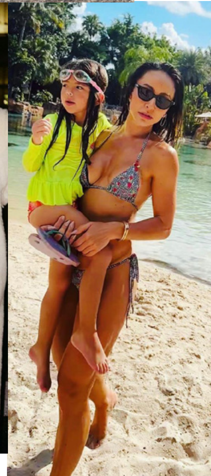
Sabrina Sato, influenciadora, Orlando.