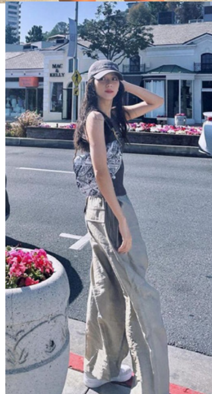
Jisoo, cantora, Los Angeles.