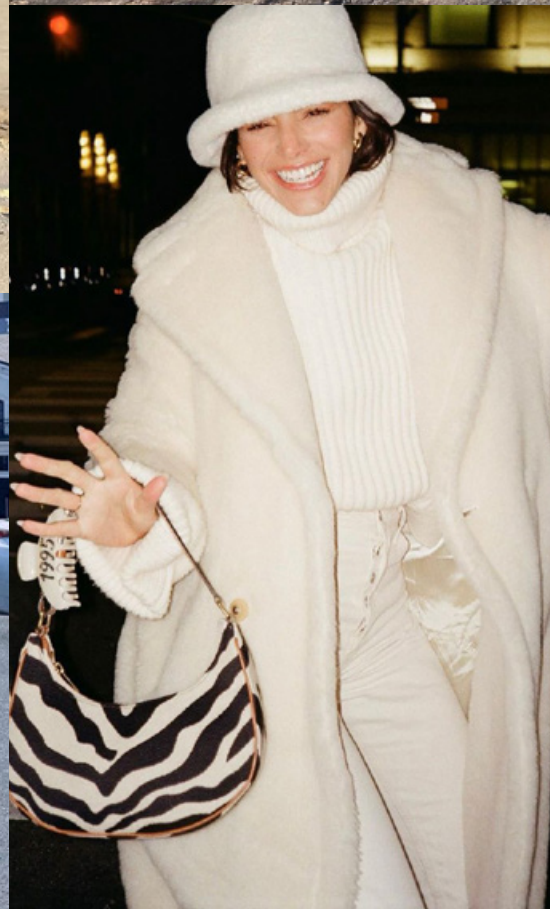
Bruna Marquezine, atriz, Nova York,