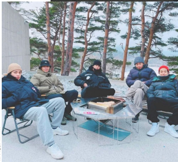
Tae-Hyung, ator e cantor, Coreia do Sul.