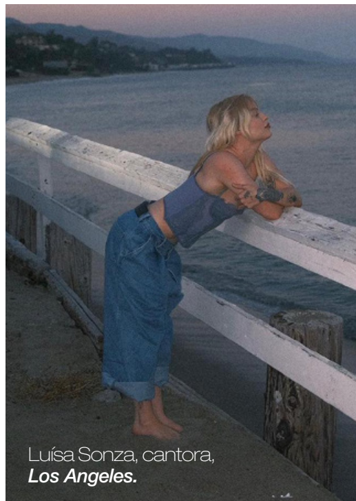
Luísa Sonza, cantora, Los Angeles.