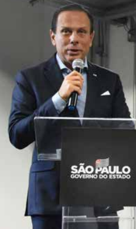
O governador João Dória e o secretário de Turismo, Vinicius Lummertz (dir)

Seja qual for a sua experiência turística, como um visitante de todas as maravilhas da região, como empresário do setor, gestor público ou novo empreendedor, todos poderão se beneficiar das novidades e perspectivas positivas que o próximo ano promete ao turismo da nossa região. E aí, qual seu roteiro para 2020?