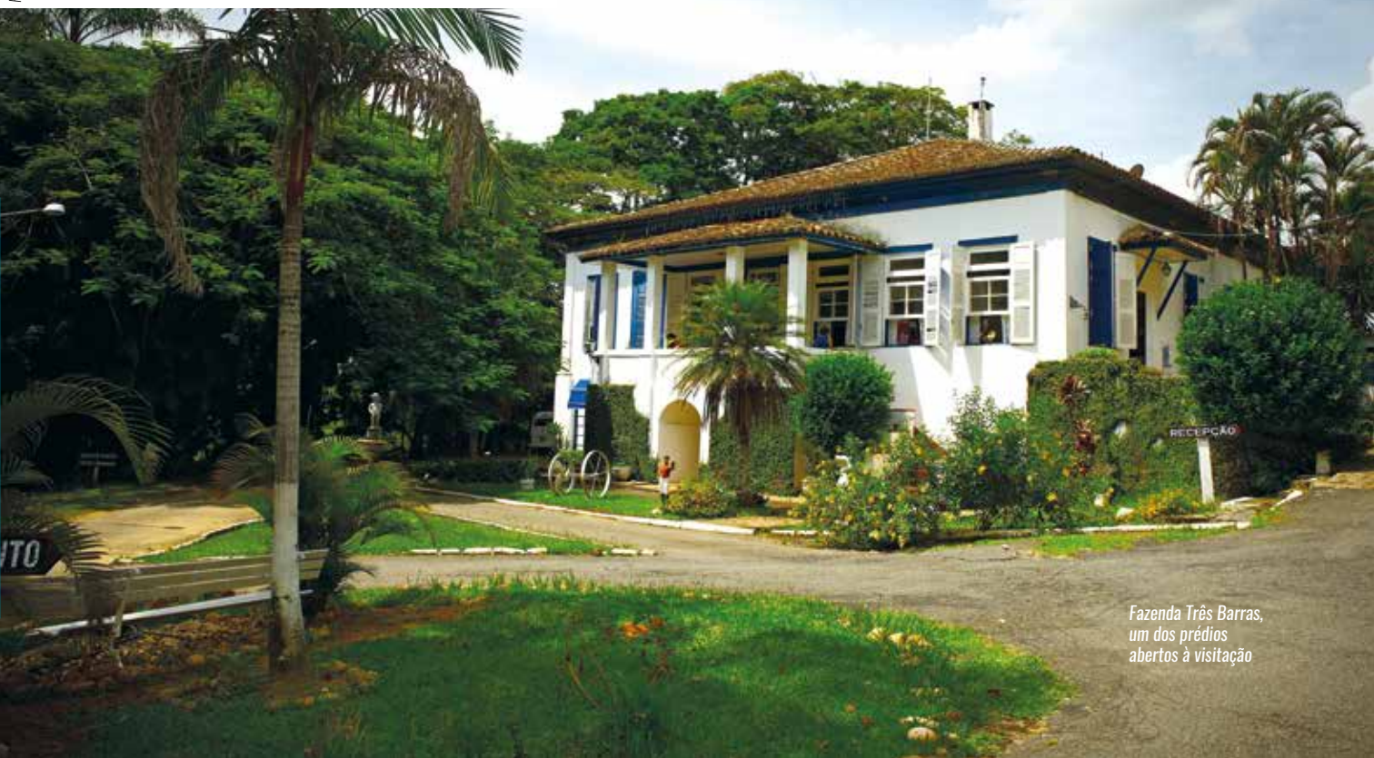
Fazenda Três Barras, um dos prédios abertos à visitação