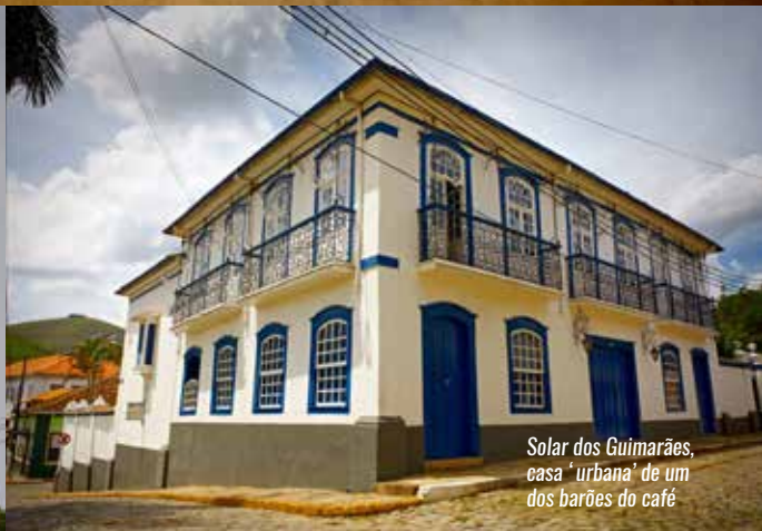
Solar dos Guimarães, casa 'urbana' de um dos barões do café