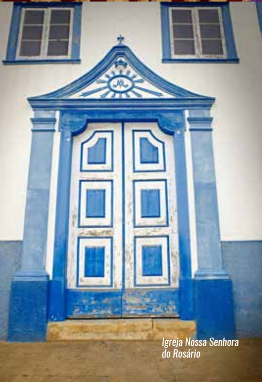
Igreja Nossa Senhora do Rosário

Os “barões do café” de Bananal formavam a elite do Império e dominavam a política e economia do Brasil; hoje as fazendas e os prédios históricos da cidade são exemplos desta época