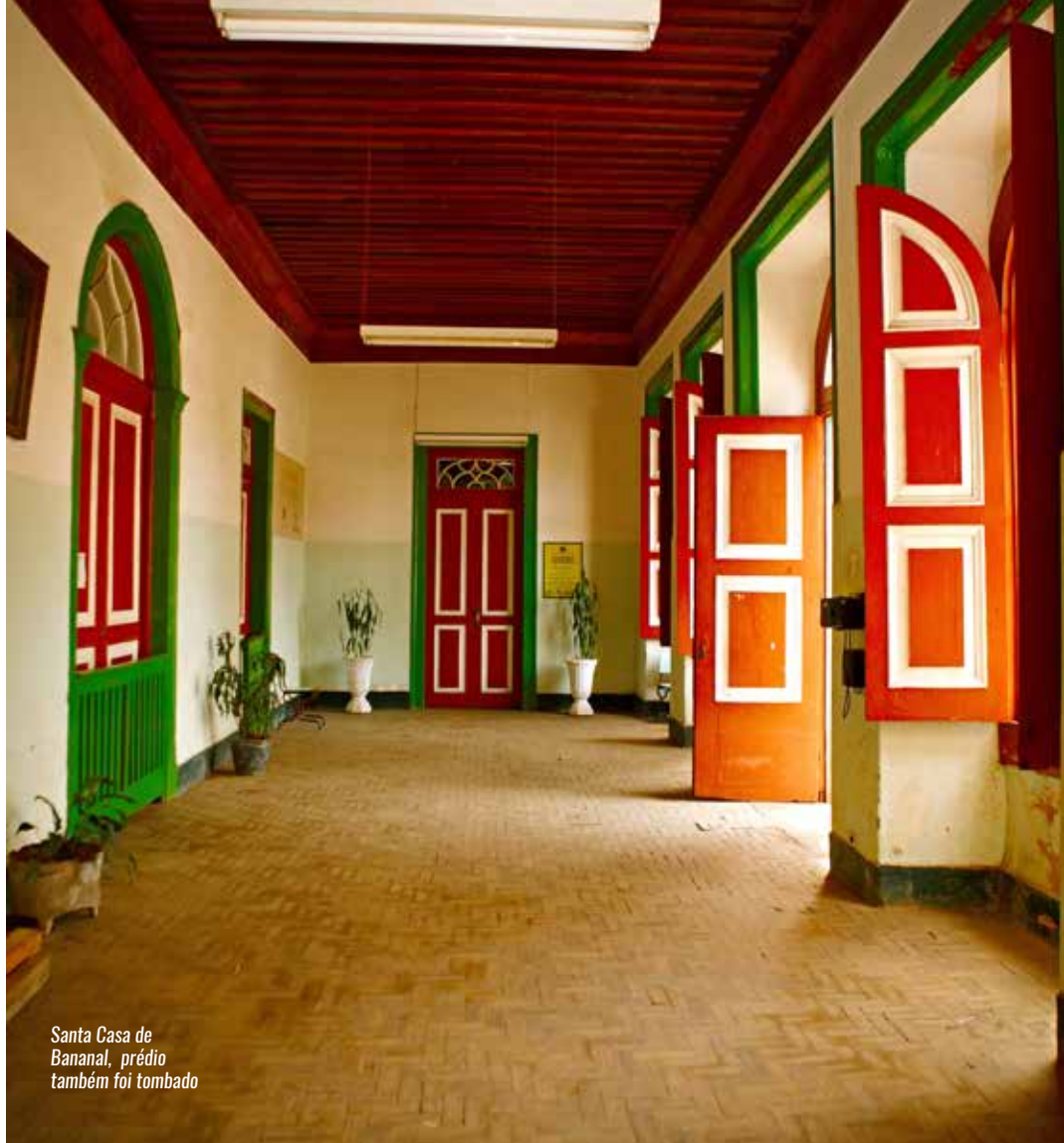
Santa Casa de Bananal, prédio também foi tombado

NOS FUNDOS DO ANTIGO PRÉDIO DA SANTA CASA, HA UM CEMITÉRIO IMPONENTE COM TUMULOS DE MÁRMORE DE CARRARA