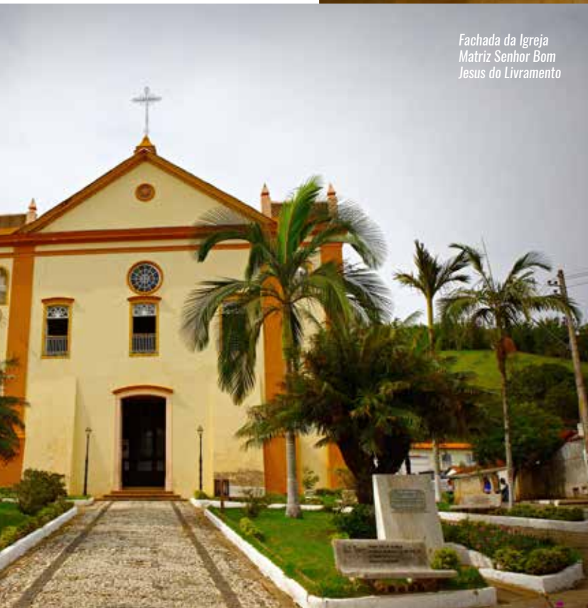
Fachada da Igreja Matriz Senhor Bom Jesus do Livramento