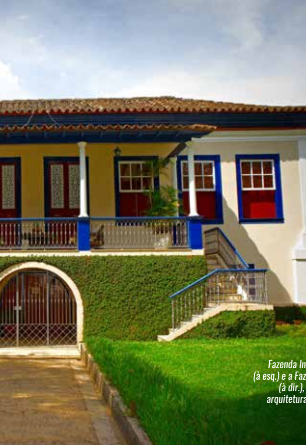
Fazenda Independência (à esq.) e a Fazenda Loanda (à dir.), exemplos da arquitetura neoclássica