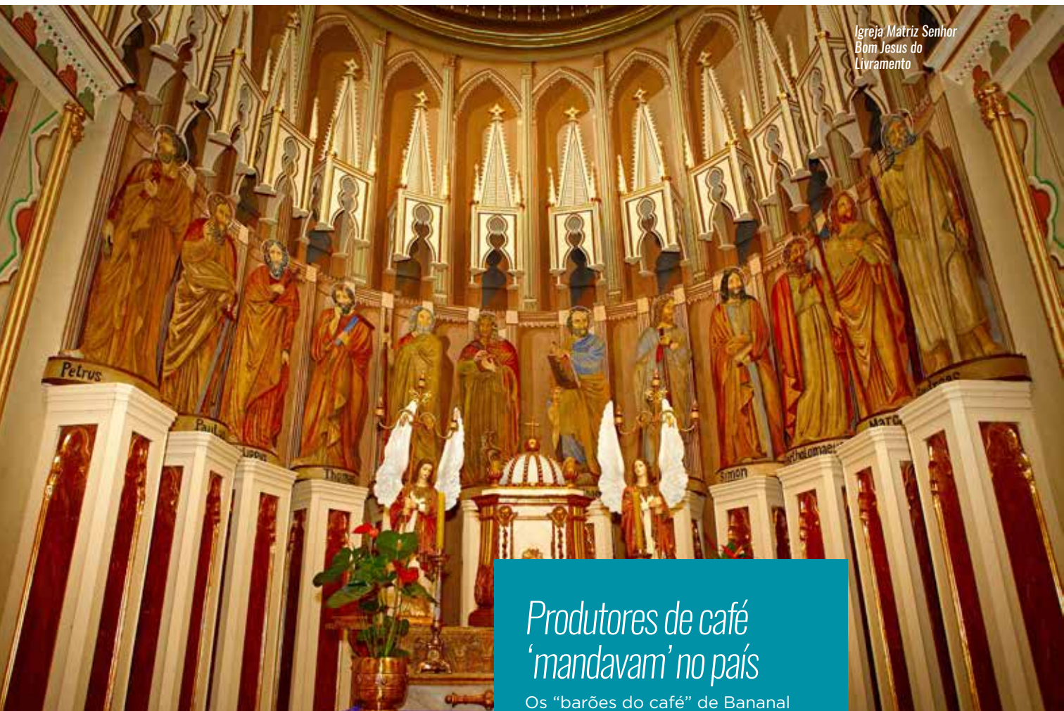
Igreja Matriz Senhor Bom Jesus do Livramento