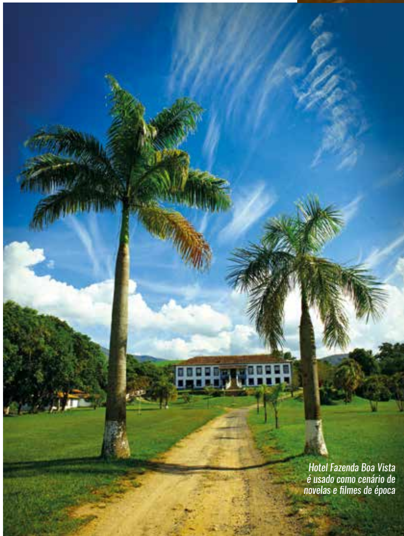
Hotel Fazenda Boa Vista é usado como cenário de novelas e filmes de época

A FAZENDA BOA VISTA TEM SEDE CONSTRUÍDA NO SÉCULO 18 E REPRESENTA UM DOS PRINCIPAIS PATRIMÔNIOS HISTÓRICOS DA REGIÃO