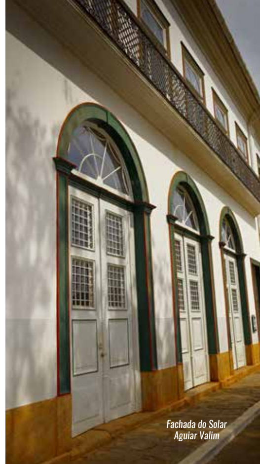
Fachada do Solar Aguiar Valim

Para os apaixonados por turismo de aventura, a cidade conta com atrativos, como morros para prática de voo livre e rapel, cachoeiras com piscinas naturais de águas claras e fundo de areia branca. ▶