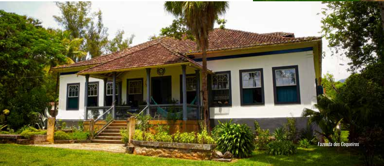
Fazenda dos Coqueiros