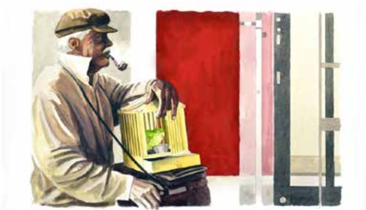
Obra: O realejo do MASP / SP

Artista plástico autodidata nasceu em Caçapava, São Paulo, em 1950. Como ilustrador e programador visual ingressou na equipe de artes gráficas da TVE no Instituto Nacional de Pesquisas Espaciais - INPE, em São José do Campos, SP, em 1970. Trabalhou como layoutman e diretor de arte em agências de publicidade em São Paulo, onde sua formação profissional foi propaganda, posteriormente em Vitória em, 1973, exercendo a mesma função em agências locais. Paralelo às atividades profissionais, desenvolveu técnicas nas artes plásticas, quando descobriu uma nova maneira de aplicar seu talento, desde então, se especializou e não parou de pintar. Participou aproximadamente de 20 exposições coletivas em São Paulo, Rio de Janeiro, Vitória e Salvador.