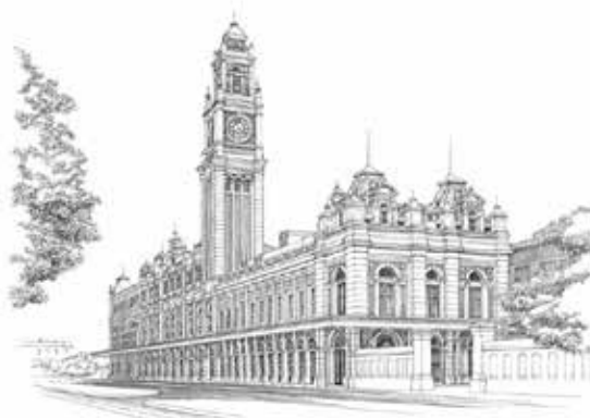
Estação da Luz - São Paulo SP