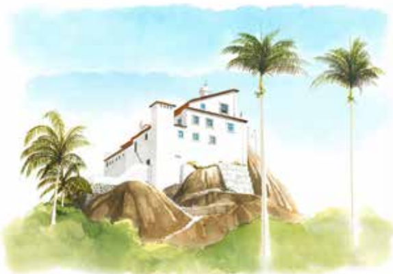
Obra: Convento da Penha (4) - Vila Velha