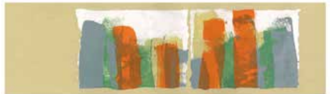
Obra: Abstrato 14