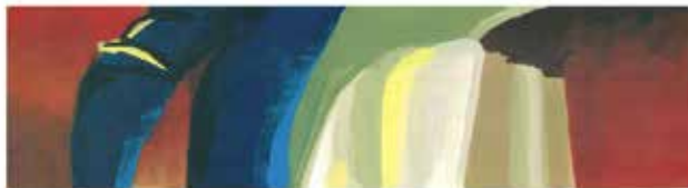
Obra: Abstrato 01