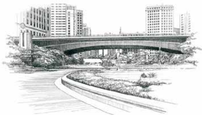
Viaduto do Chá - São Paulo SP