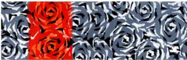
Obra: Abstrato 14