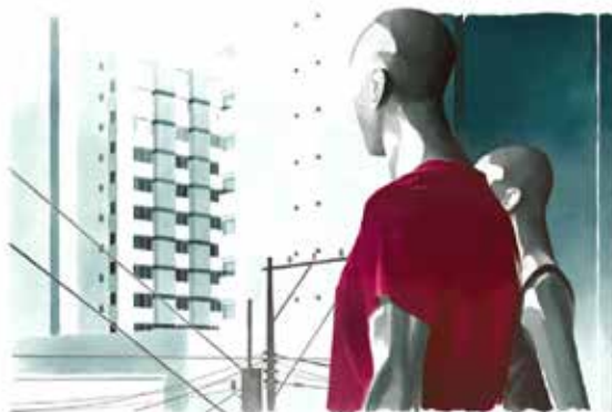
Obra: Vitines 06

Produção: Ilustrações, bicos de pena, aquarela abstratos e desenhos