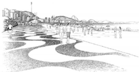
Copacabana - Rio de Janeiro RJ