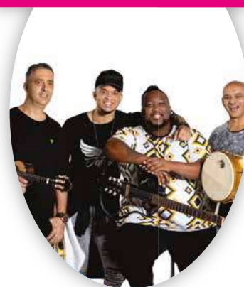
24 - EXALTASAMBA