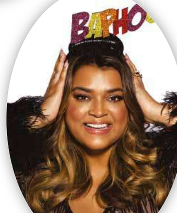
25 - PRETA GIL

CONFIRA A PROGRAMAÇÃO COMPLETA EM CARAGUATATUBA.SP.GOV.BR