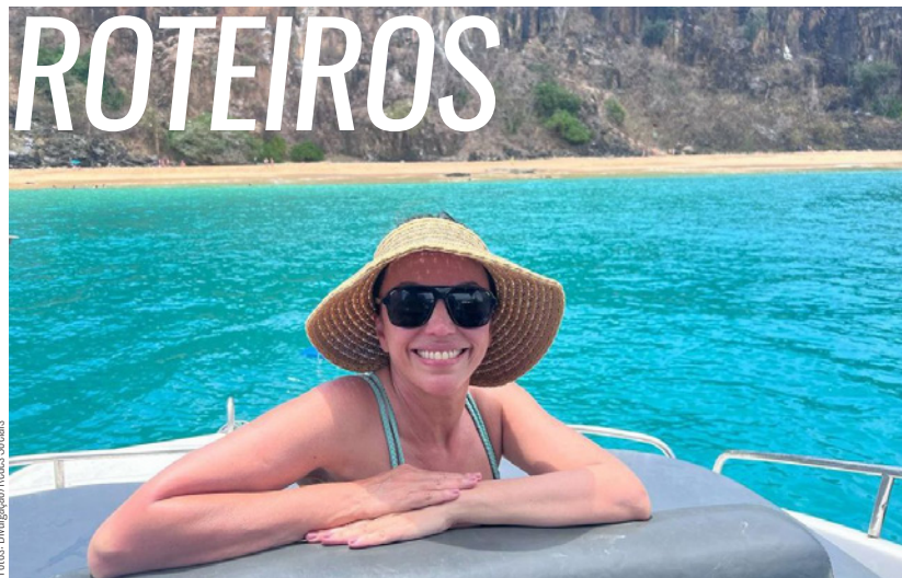
Ana Paula Araújo, jornalista e apresentadora, Fernando de Noronha 2023.