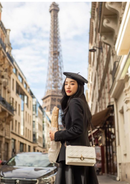
TontaWan, atriz e modelo, Paris 2023.