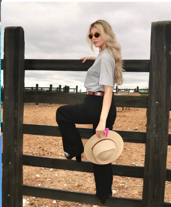
Catarina Tourinho, youtuber e influenciadora, Chapada Diamantina, Bahia 2023.