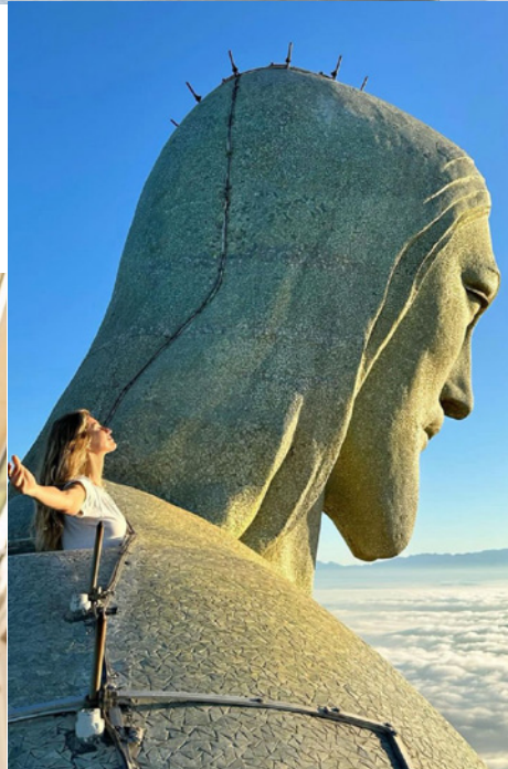
Gisele Bündchen, modelo e influenciadora, Rio de Janeiro, 2023.