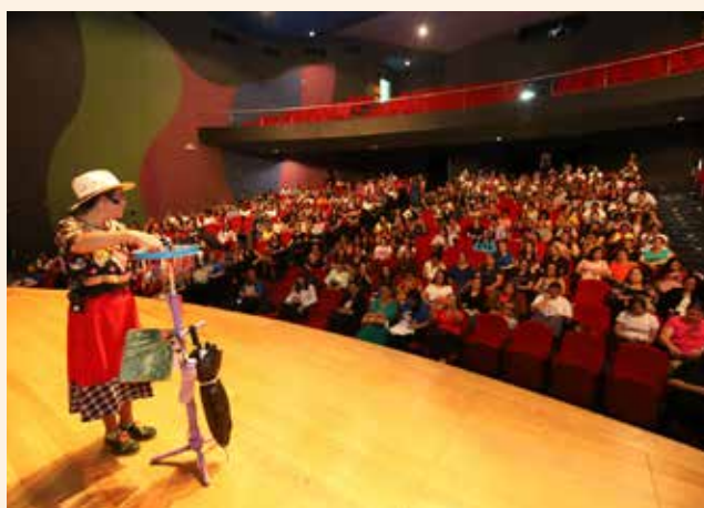
Apresentação das Boas Práticas de 2023, com o tema “Jacareí Matematic@ndo ODS”, no Teatro Ariano Suassuna