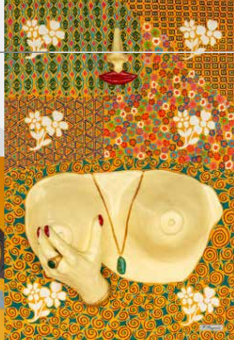
O toque sensível nas mamas