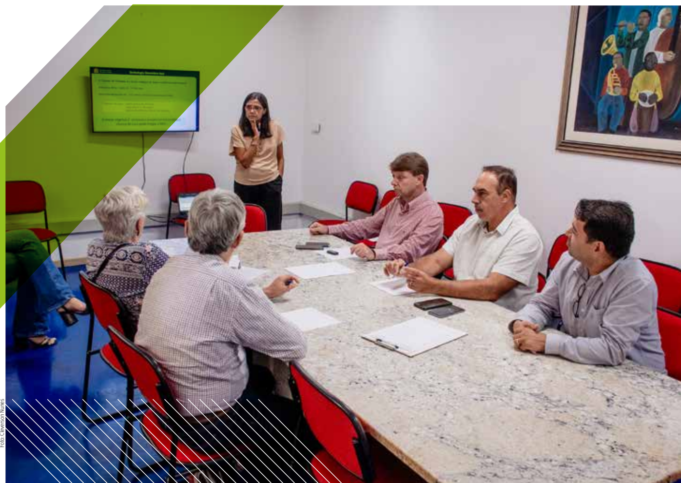
Membros da frente parlamentar reunidos com representantes da Secretaria Municipal de Saúde

RECURSOS PARA CUSTEAR HOSPITAIS E FILA DE EXAME ESTÃO ENTRE OS TEMAS TRATADOS PELOS VEREADORES