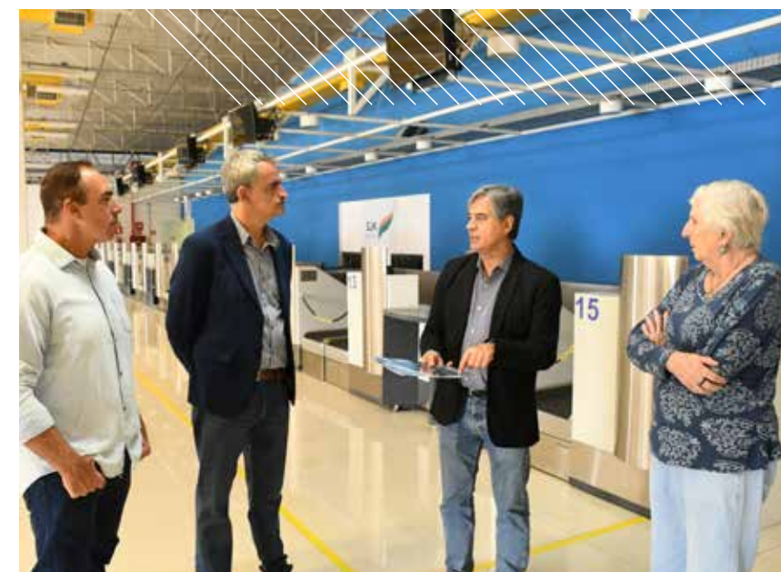
Vereadores visitaram o GAIA (acima) para conhecer as novas instalações e foram ao aeroporto de São José solicitar a implantação de uma “calm zone”