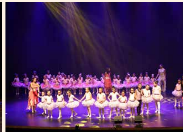
Festival de Dança de reúne 600 alunos municipais