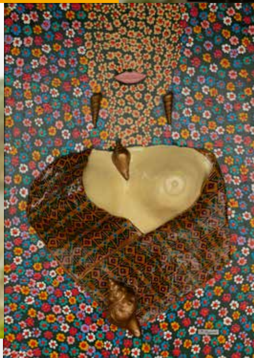
A dama de xale