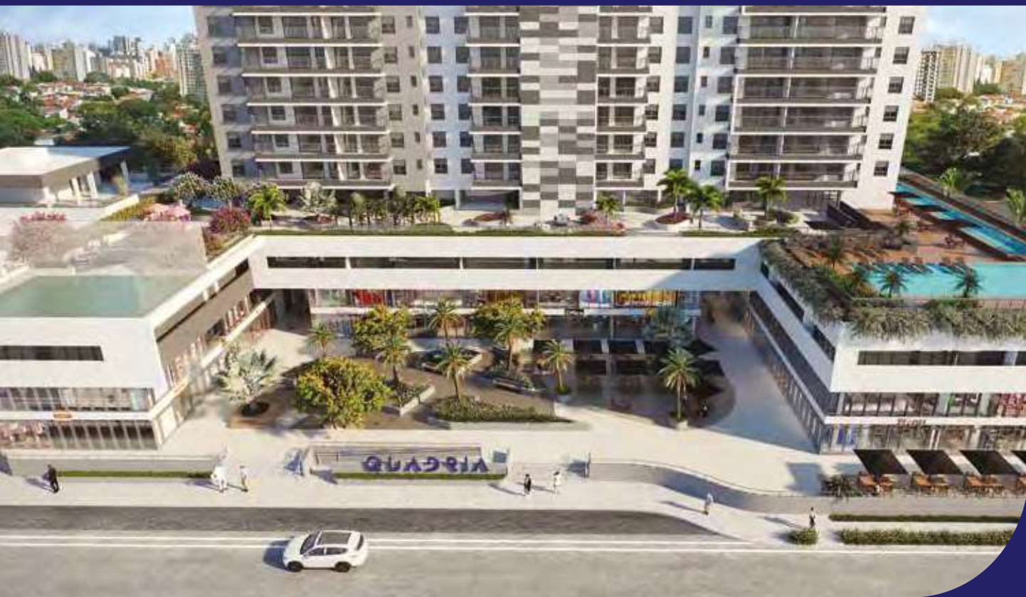
IMAGEM MÉRAMENTE ILUSTRATIVA

3,2 e 1 DORMITÓRIOS 92m 2 , 69m 2 e 45m 2