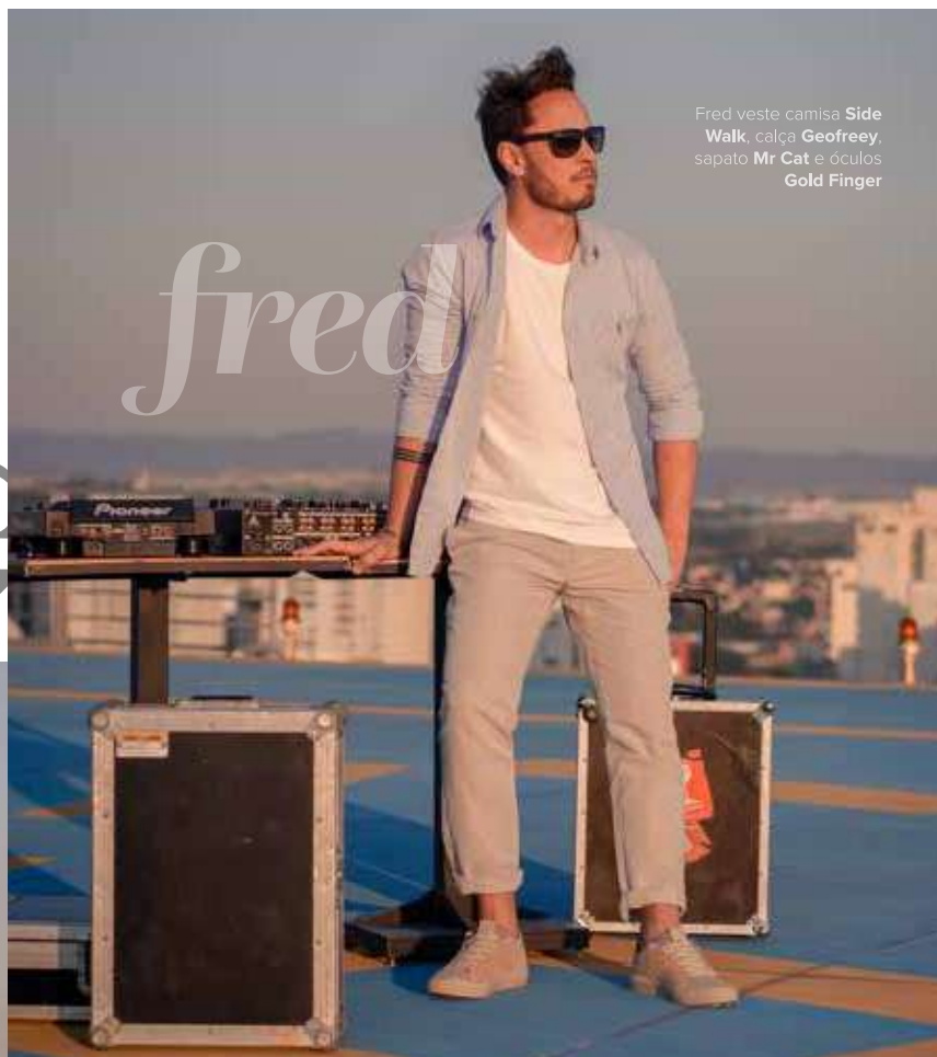
Fred veste camisa Side Walk, calça Geoffrey, sapato Mr Cat e óculos Gold Finger

Na composição com as peças jeans, sobreposições de tecidos como o linho e acessórios com detalhes refinados podem tornar o resultado final mais elegante.