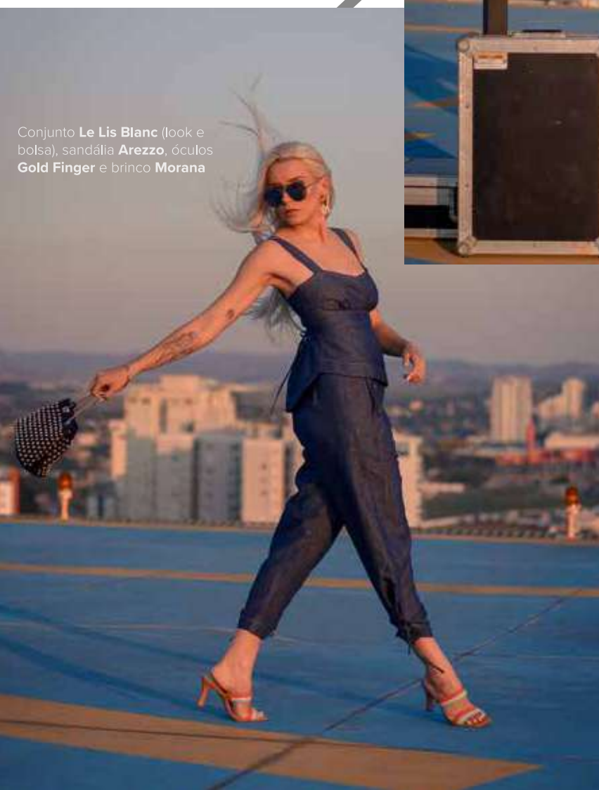
Conjunto Le Lis Blanc (look e bolsa), sandália Arezzo, óculos Gold Finger e brinco Morana