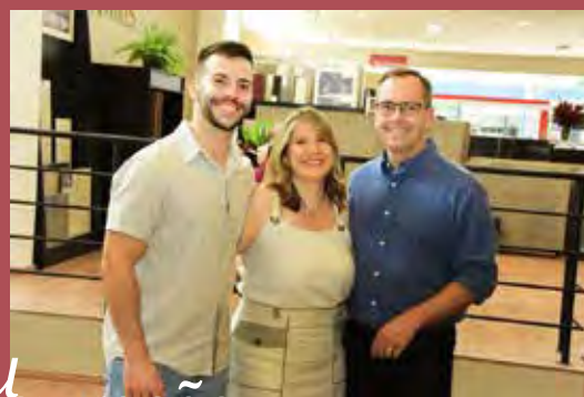
Inauguração ABC da Construção