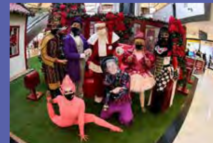
A campanha de Natal do Colinas Shopping começou