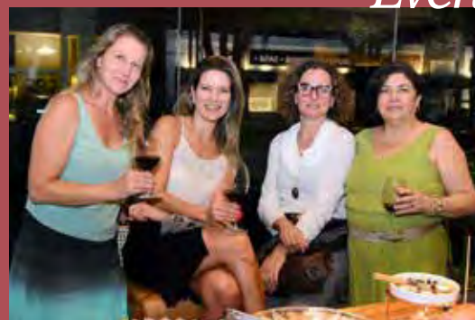
Evento Todeschini agita arquitetura do Vale