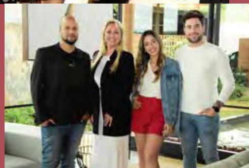
Visita ilustre da Família Abravanel na Mostra Atmosferas