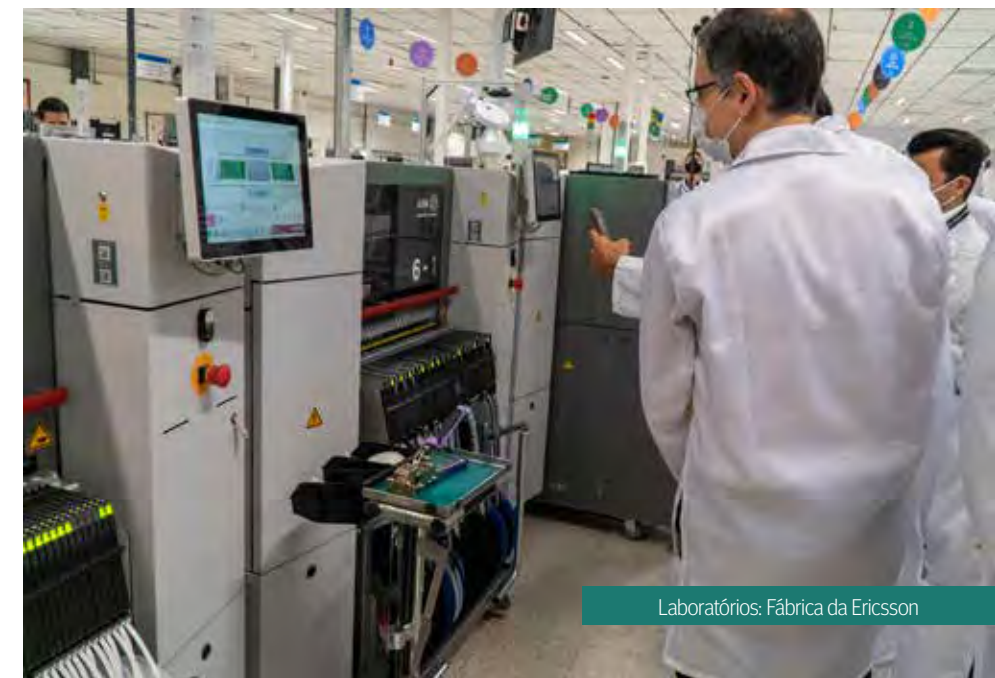
Laboratórios: Fábrica da Ericsson