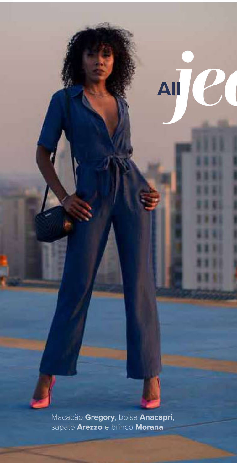
Macac o Gregory , bolsa Anacapri , sapato Arezzo e brinco Morana