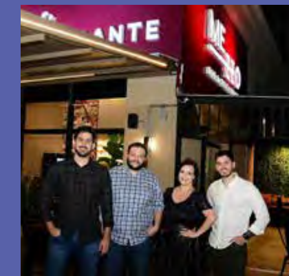
Inauguração do restaurante MEZZO em grande estilo