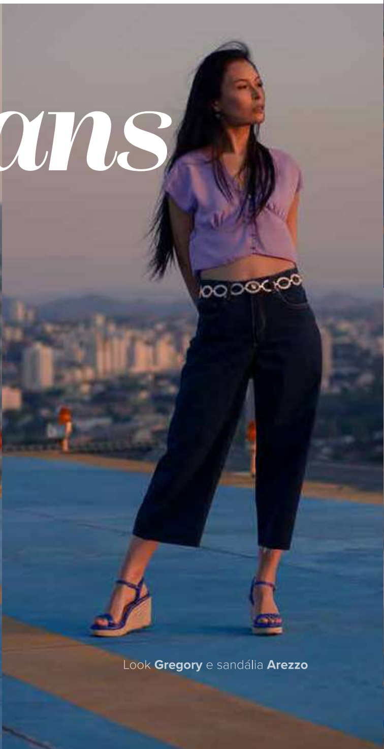
Look Gregory e sand lia Arezzo