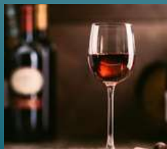
MEON MENU Vinhos e histórias

ELES ASSUMIRAM O GOVERNO DO MAIS RICO ESTADO DO PAÍS