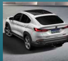
VELOZ Fiat Fastback, design, performance e tecnologia