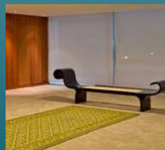
ARQUITETURA Decoração destruída no Palácio do Congresso volta a ser tendência