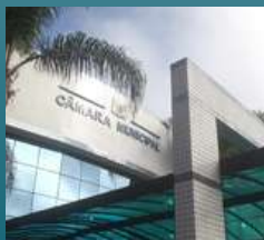
POLÍTICA Novos presidentes são eleitos nas câmaras municipais