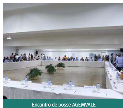
Encontro de posse AGEMVALE

Felício Ramuth, vice-governador do Estado de São Paulo