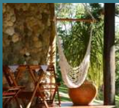
CARNAVAL Dicas para quem procura tranquilidade no Carnaval